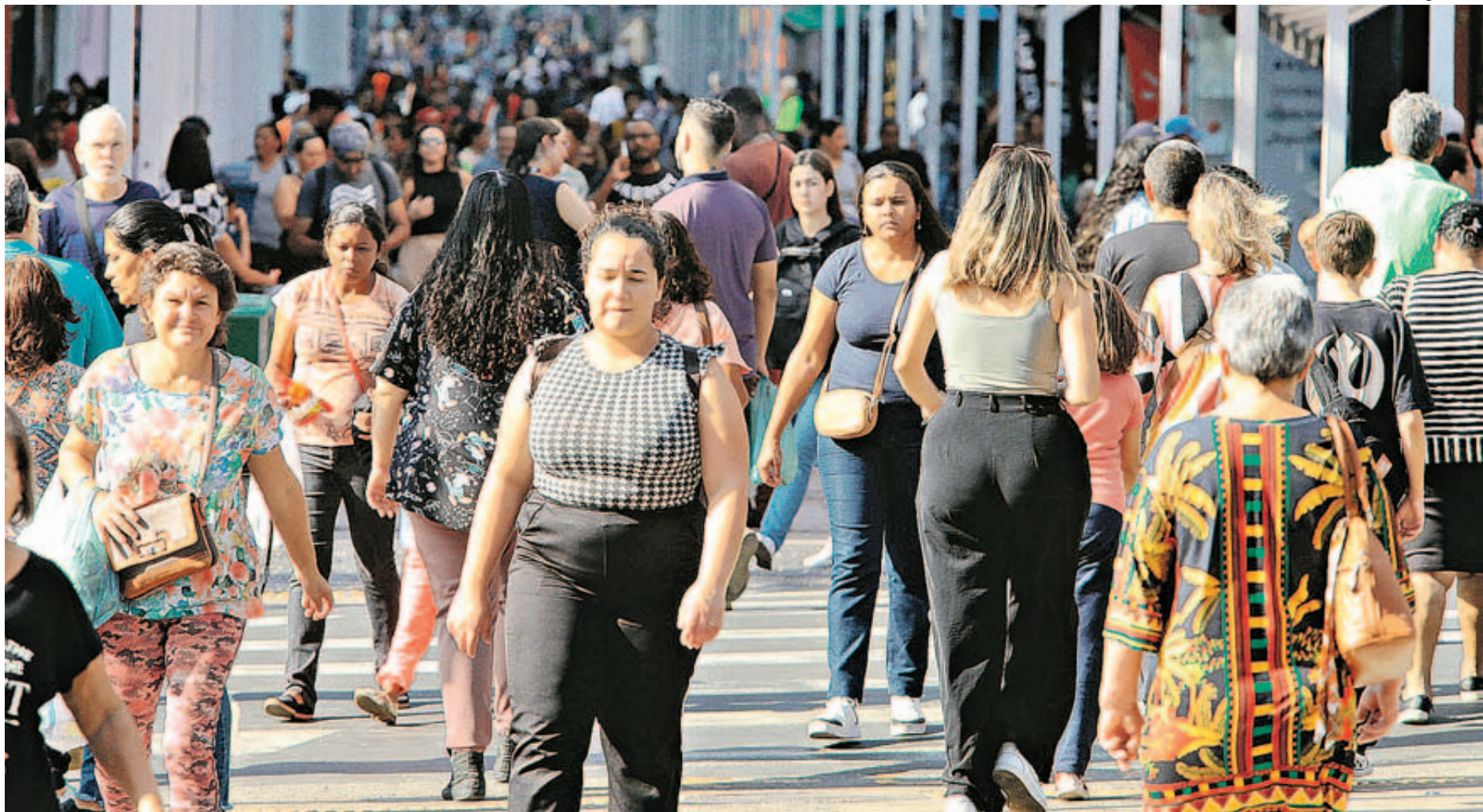
Desde o último Censo, realizado em 2010, a população de Campinas cresceu 5,4%, percentual abaixo do índice nacional, que ficou em 6,5%; cidade tem atualmente 501.952 domicílios

"As pessoas estão optando por morar em cidades no entorno das metrópoles, onde