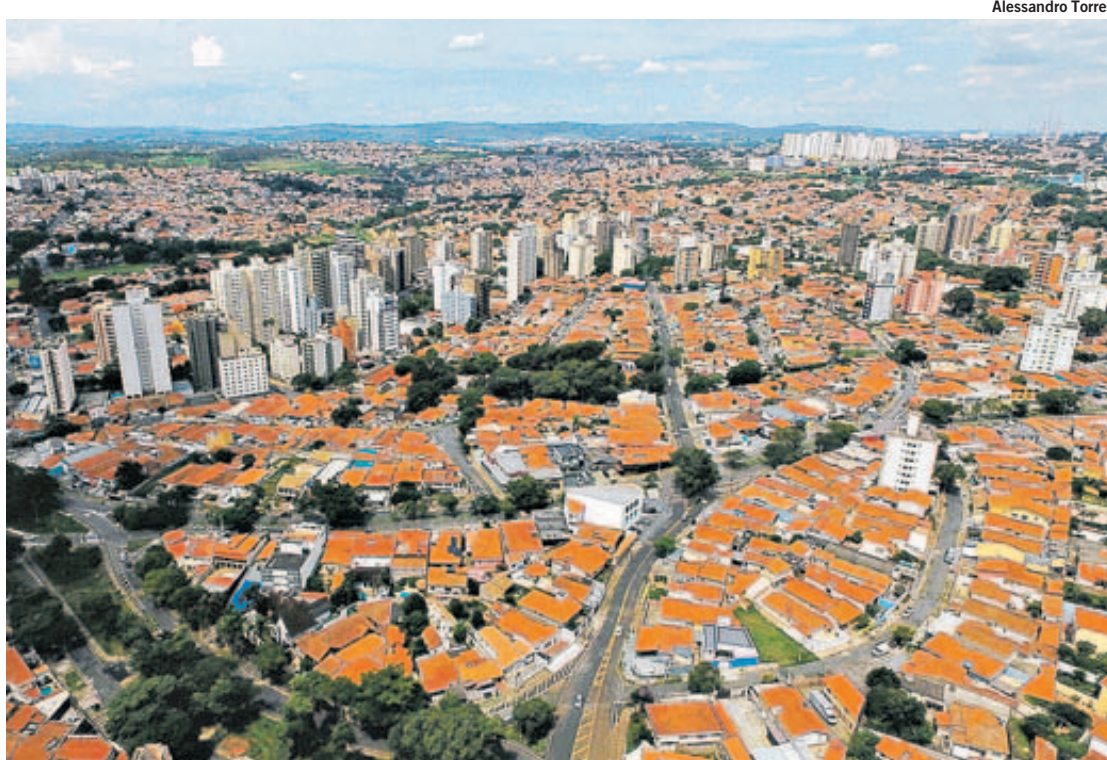
A Prefeitura de Campinas acredita que a população da cidade deverá continuar crescendo ao longo dos próximos anos e já projeta ações para atender as demandas futuras

Ao Correio Popular, a assessora técnica do IBGE informou que os próximos recortes do Censo, com dados sobre idade média da população, cor e religião, entre outros, devem ser divulgados nas próximas semanas, mas ainda não há uma data definida para que isso ocorra, de acordo com o Instituto.